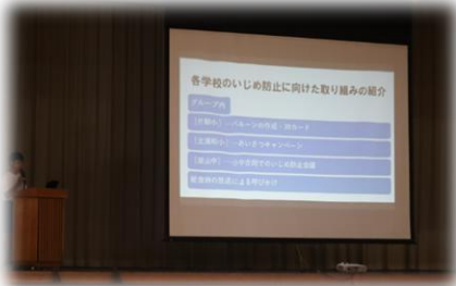
○子どもサミット参加報告

「誰もが安心して暮らせる社会をつくる力」を育む、ひまわり特別支援学校との交流会の実施。