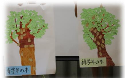
○「いいねの日」「いいねの木」の取り組み