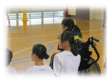
○ひまわり特別支援学校との交流